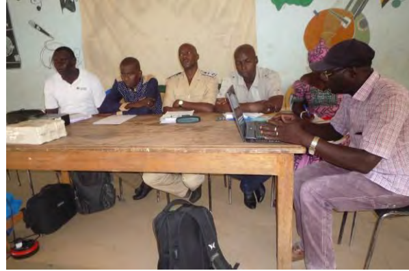
Forum de partage sur la convention locale à Baghagha le 28 juin 2016