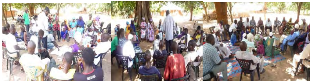
Groupes esquisses harmonisation des règles

Article I : A l'exception du droit d'usage, toute coupe de bois à usage commerciale est interdite conformément au code forestier.